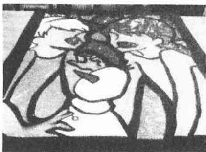
美術部 ステンドグラス

10月30日（木）の文化発表会（ステージ・展示）だけでも見ごたえ十分です。保護者の皆様、地域の皆様もぜひご来場ください。