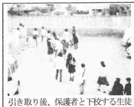
引き取り後、保護者と下校する生徒

授業参観後、本校で初めての防災引き取り訓練が行われました。3.11の東日本大震災以降、防災計画が見直され、横浜で震度5強の地震を観測した場合、生徒は学校に留め置くことになりました。小学校では、以前から引き取り訓練を行っていましたが、中学校でも訓練を行いました。当日は、授業終了後、帰りの学活で生徒に指導した後、引き取り訓練を行いました。大きな混乱もなく、97%の生徒が、30分以内に引き取りを完了しました。ありがとうございます。今後はさらに、小学校との連携や地域との連携を考えた防災教育を進めていきたいと思っております。