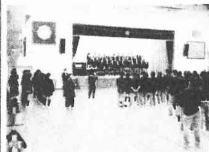
3年舞岡小でリハーサル