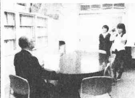
オープニングビデオ撮影中