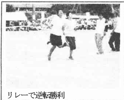
リレーで逆転勝利

10月12日(日)に本校学区の3つの連合町内会・自治会で運動会が行われました。写真は、戸塚第3地区の健民体育大会40周年を記念して特別に行われた学校対抗リレー(小・中合同チーム 東戸塚小・舞岡中チーム)の様子です。アンカーの白い体操着の選手がバトンを受けたときに30m以上あった差をゴール前で逆転した場面です。観客、大会役員の方から「感動した」というお言葉をいただきました。その他の地域でも、「大縄跳び」「地区対抗のリレー」や「レク種目」に出場して地域に貢献していました。年々中学生の参加が多くなっているようにも感じました。