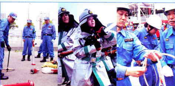
活動に必要な知識と技術を身に着ける各種訓練(西消防団)