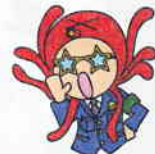
こわくなったら おおごえて