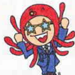
おともだちと あそぼうね