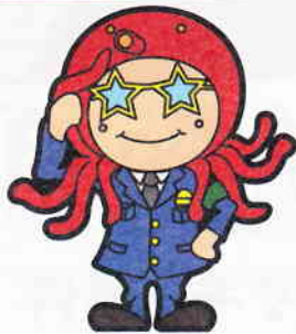
僕の名前は、おおだこポリス