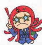
だまされて ついていけない