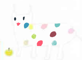
戸塚区のマスケット 「ウナシー」

主任児童委員は、地区のなかで担当区域を持たず、子育て、不登校、いじめ、虐待など児童に関する分野を専門に担当し、区役所や学校、児童相談所などと連携しながら活動をすすめています。