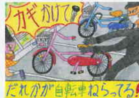
最優秀賞 横浜市立中田小 5年 崎本 彩夢