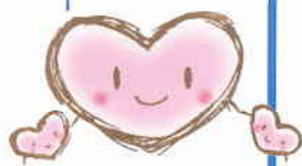
とつかハートプラン のマスケット 「こころん」

民生委員は 地域を見守り、地域住民の身近な相談相手、 専門機関へのつなぎ役です。