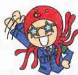
おうちのひとにいきます