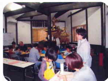
日曜日はお父さんも参加

参加者：子供たちが約30名登録(20家族)、 各回15人程度(日曜日には、お父さんたちも参加)