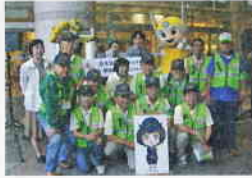
横須賀防犯協会 防犯啓発キャンペーン

神奈川県自転車商協同組合 045-311-6168 http://www.kanasho.jp