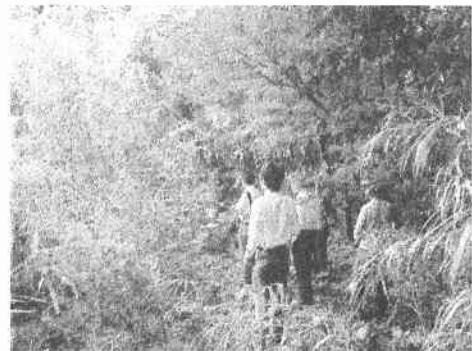
（写真は昨年の現地調査時）