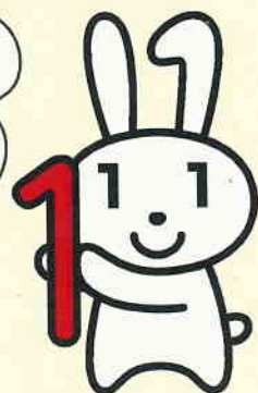
マイナンバーキャラクター 「マイナちゃん」