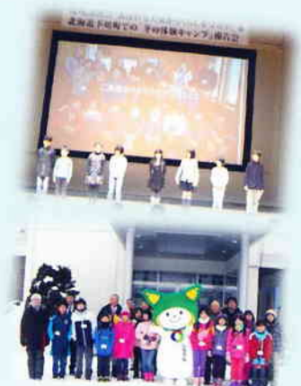
* 昨年の報告会と北海道下川町で行われた冬の体験キャンプでの子どもたち