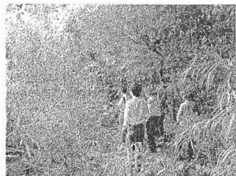
（写真は昨年の現地調査時）