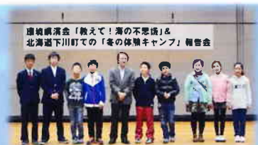
環境講演会「教えて！海の不思議」& 北海道下川町での「冬の体験キャンプ」報告会

※川上地区連合町内会は2011年に下川町、戸塚区と3者による友好協定を締結し、毎年子ども達の交流会を実施しています。