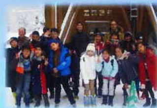
*昨年の報告会と北海道下川町で行われた冬の体験キャンプでの子どもたち